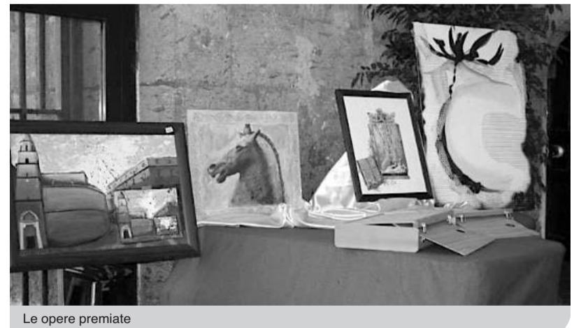
Le opere premiate

state premiate nove. Fuori concorso sono stati premiati da Fernando Gombos come "Aspiranti concorrenti" alcuni bimbi. La loro presenza è stata spunto per sottolineare il problema derivante dalle malformazioni maxillo facciali, oggi fortunatamente curabili. Fortunato Danise ha definito "L'Angelo del vicolo" espressione della "digital art", intesa come composizione di più tecniche: fotografia, intervento pittorico e applicazione di zone fatte con fogli d'oro. Nell'opera- ha continuato l'autore- sono raffigurati i tre personaggi, per lui fondamentali, della cultura della Napoli antica: la sirena Partenope, che indica l'origine e la fine; il dio Nilo, che rappresenta l'abbondanza e la ricchezza; l'angelo-scugnizzo, che simbo-